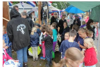
Wachtrij om naar huis te gaan